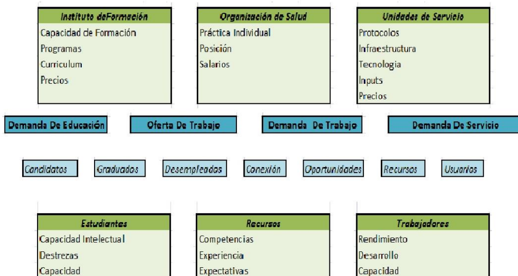
Figura N°2: caracterización del mercado laboral