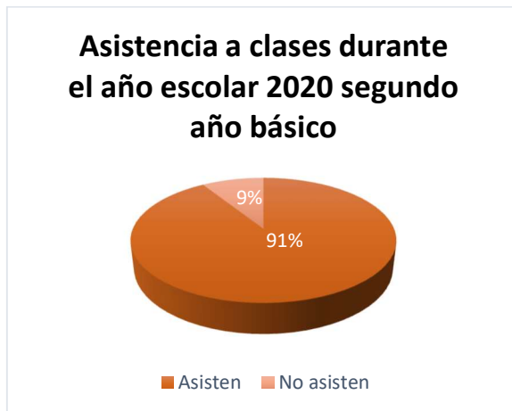
Gráfico N° 3 y 4: Permanencia durante el año escolar 2020

Por otra parte, no todos los estudiantes han podido participar de las clases en línea, como lo señala la estudiante de segundo año básico, dos de sus compañeros no han ingresado a ninguna clase, a diferencia del estudiante de sexto año básico que afirma que todos sus compañeros participan en clases.