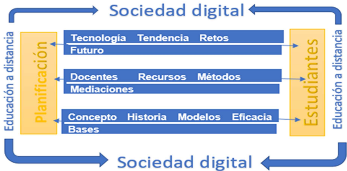
Gráfico N°1: Sociedad digital