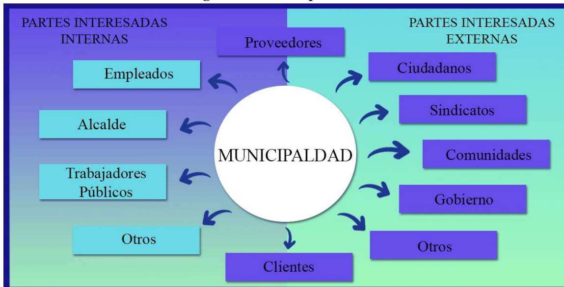
Figura N°1: “Grupos de interés”