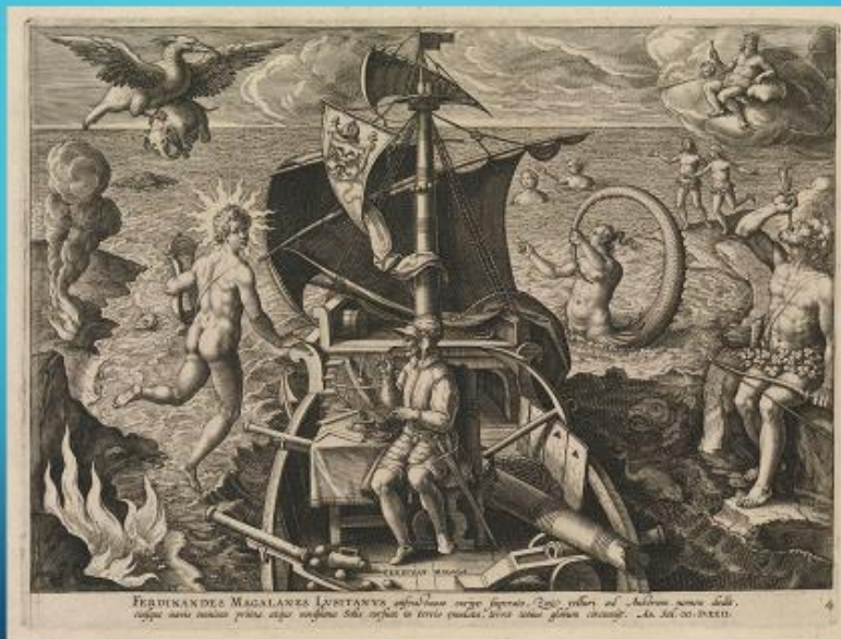
FERDINANDE MAGALANES LUSTANVS, exploratoris regis Hispanie. 290. velox et Audax natus dicitur, cuius nomen prima etiam regibus tota regna in terra pacata, hinc inde gloriis circumdant. An. 1480. XXXIIII.