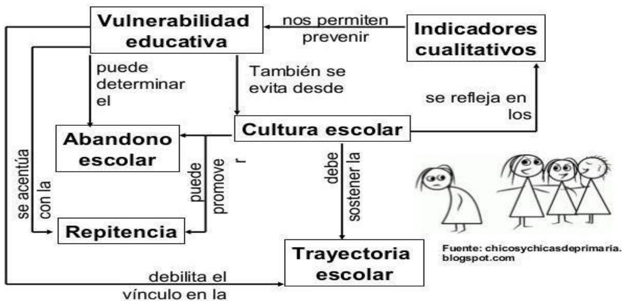
F.3: Vulnerabilidad educativa

Todo esto puede ser previsto con métodos cualitativos para realizar un análisis temprano de la situación de los alumnos. Por otro lado, grafica como la trayectoria escolar puede verse debilitada por la vulnerabilidad escolar, aun cuando ésta (trayectoria escolar) es una sostenedora de la cultura. Todo lo anterior recalca la idea de que la vulnerabilidad escolar puede ser prevenida y evitar caer en abandono si se toman las medidas correspondientes a tiempo.