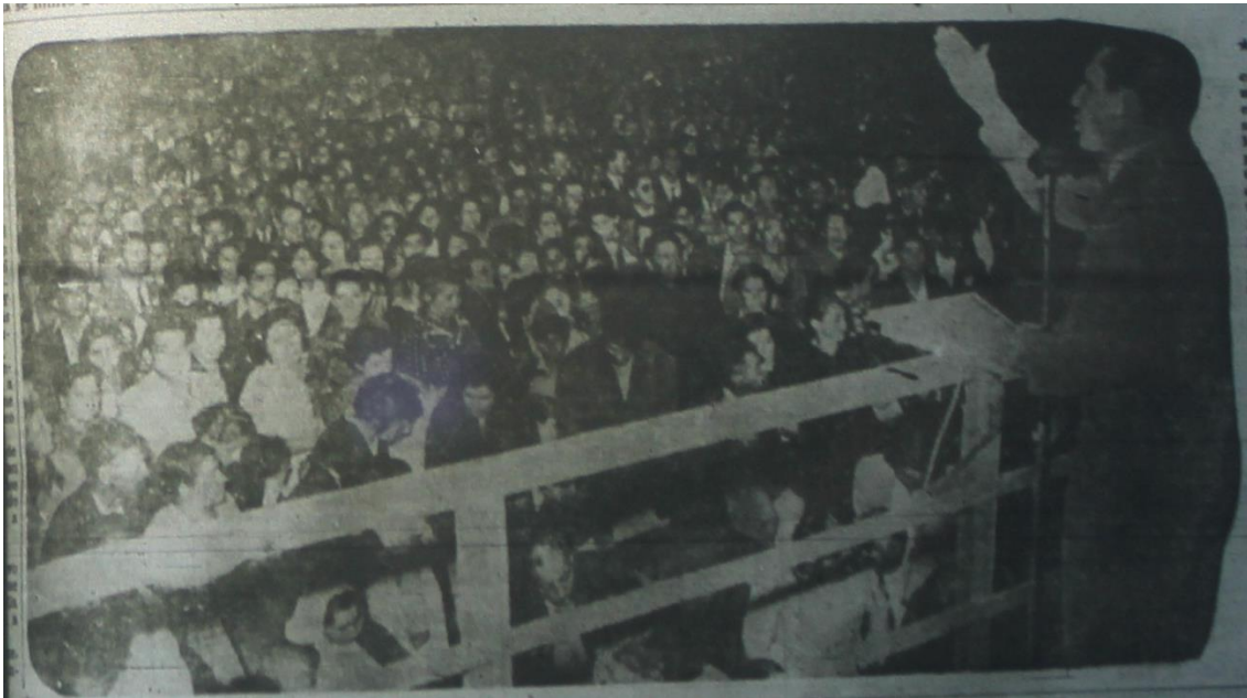
Fotografía de las concentraciones en Parque Cousiño

La cobertura de la noticia continuará señalando milagros y figurando en la portada del diario, dando nombres, direcciones y testimonios de los sanados, además de señalar diversos casos que venían de ciudades como Parral, Rancagua o incluso de Bolivia.