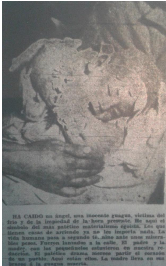
Niño fallecido llevado a las oficinas del diario.

Una guagua murió de frío por falta de habitación. Una humilde mujer con el cadáver de su hijo entre sus brazos vino a nuestro diario a relatar su tragedia. Hace siete meses que esa familia con cuatro niños pequeños anda buscando una pieza en la cual cobijarse; pero no ha encontrado ninguna.