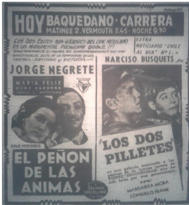
Edición N°49. Martes 4 de abril de 1944. Pág. 11.