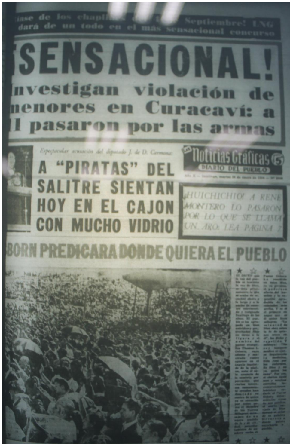
Portada Las Noticias Gráficas , martes 25 de enero de 1954