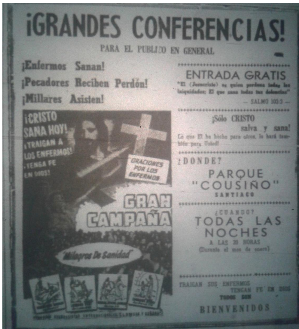
Afiche publicitario de las campañas del pastor Osborn.

“Según fuimos informados, hoy deben llegar a Santiago un centenar de enfermos de Temuco, Valdivia, Concepción, Talca, Chillán, Molina, Curicó, La Serena, Ovalle, Calama, Tocopilla, Taltal, Pueblo Hundido, Caldera, Antofagasta, Iquique, Arica y otras ciudades del país que vienen en busca de salud que están seguros de hallar en la elipse del Parque Cousiño, cuando escuchen las enseñanzas del Pastor Thomas L. Osborn...” 193