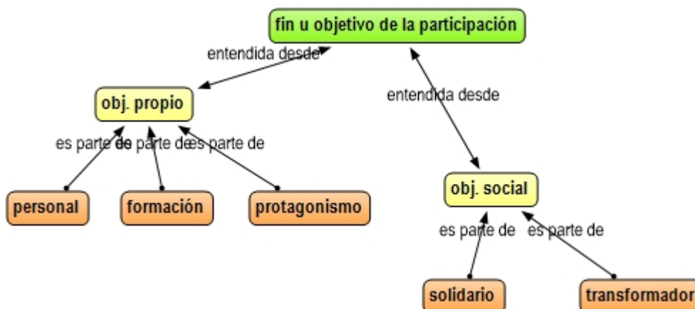
Ilustración 3: Mapa de subcódigos y características realizado por Atlas.ti, Elaboración propia.

En los objetivos de la participación para las y los estudiantes secundarios en los establecimientos educativos se reconocieron dos instancias, una personal y una más social.