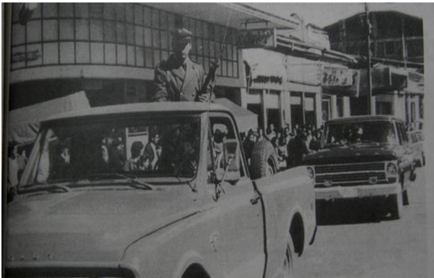
Chillan en Dictadura, Calle 5 de Abril / El Roble