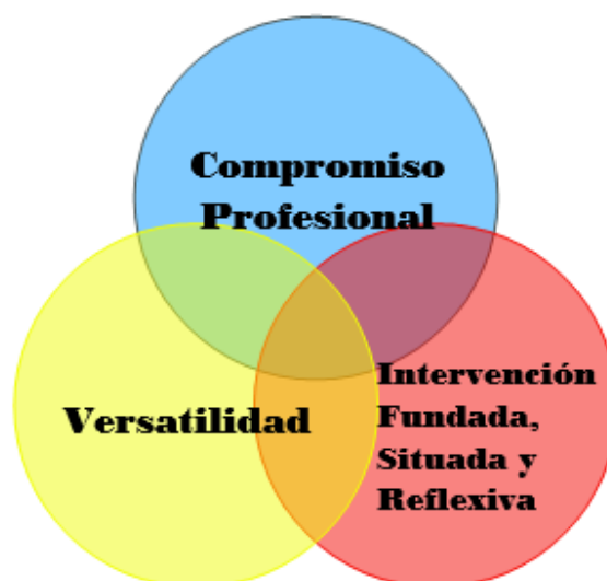
Ilustración 4 Elementos característicos de Los/as Egresados/as de Trabajo Social UBB.

por el objeto de estudio, se establece que tres de estos son primordiales y transversales durante las generaciones de egresados/as, los cuales son: