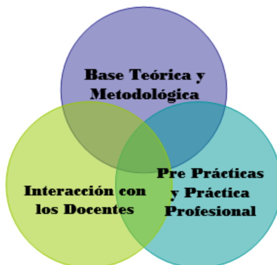
Ilustración 3 Hitos importantes de la Formación Académica.

los procesos de pre-práctica y profesional y además de rescatar la interacción con los docentes, son fundamentales para los estudiantes, lo cual es la base de su identidad, ya que lo antes mencionado son las herramientas que determinan la propia identidad profesional. Estos tres elementos constituyen hitos relevantes en el discurso de los/as egresados/as de Trabajo Social, los cuales marcaron su proceso de formación como estudiantes, llevándolos así al campo laboral al egresar de la universidad.