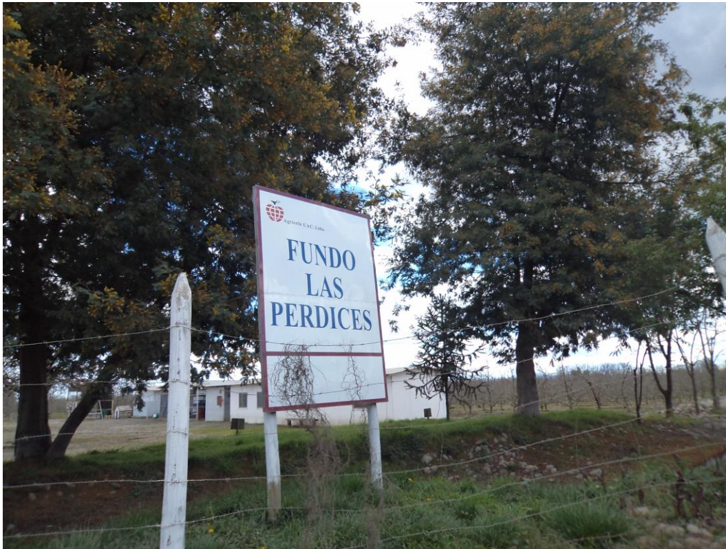
1. Fundo Santa Eugenia, hoy llamado "Las Perdices" que pertenece a Agrícola UAC Ltda.