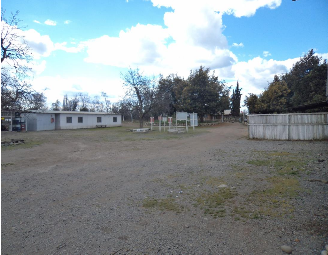
5. Sector en donde se encontraba la quinta de nogales