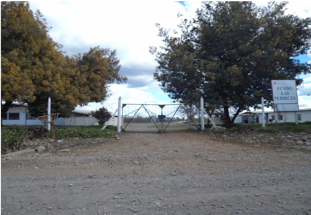
6. Entrada del fundo Las Perdices.