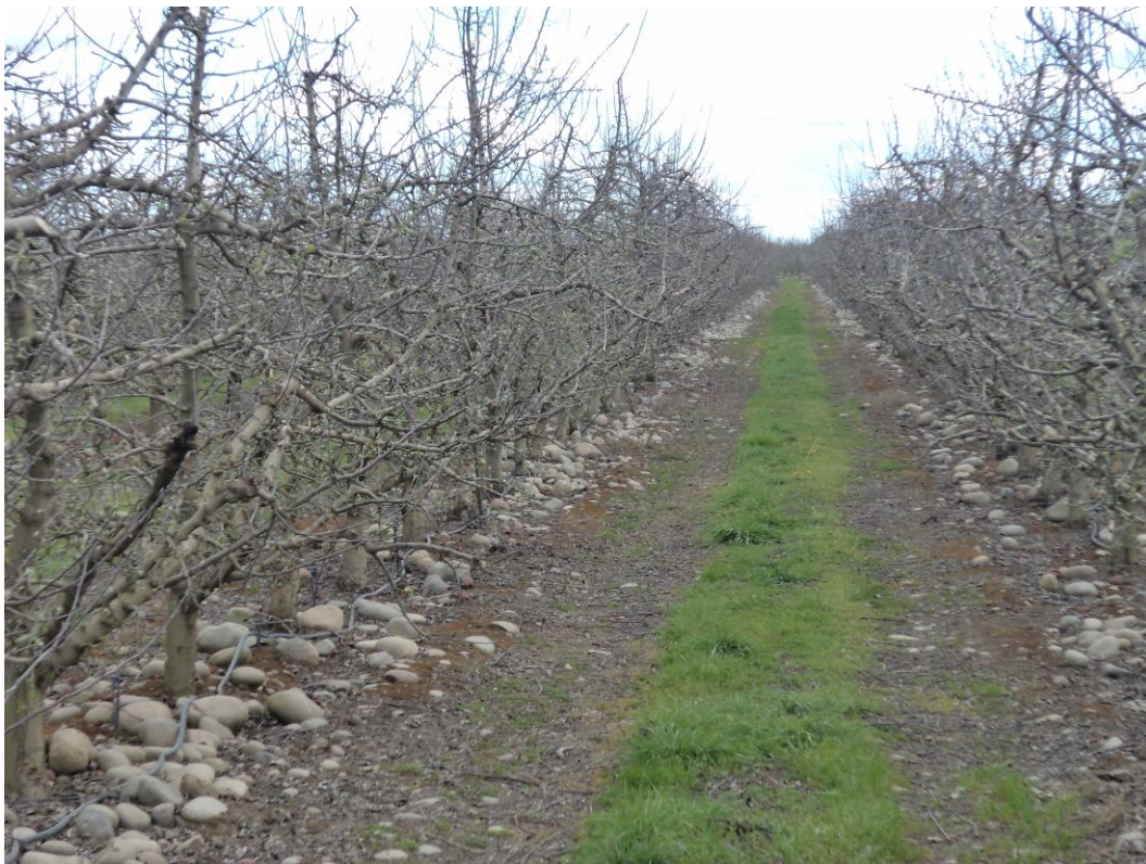
2. Actualmente el fundo se dedica a el cultivo de manzanas