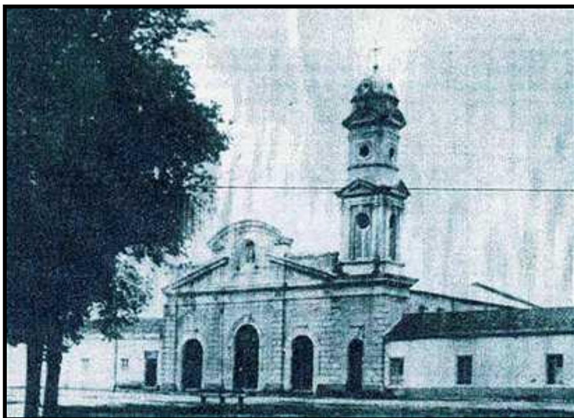
Fotografía del Templo de San Sebastián en 1930.

sufrido una remodelación total. La fachada se estucó, se reconfiguró un nuevo frontón y la torre se trató de recuperar lo que quedó de ella. 76