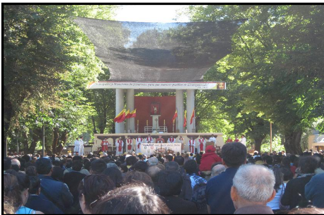
Actual Campo de Oración del Santuario de San Sebastián de Yumbel.

Aun así, en las diferentes entrevistas se repiten las frases "es de aquí", "siempre aquí", "debe estar aquí", "no se debe mover de aquí", etc. Revela la profunda identidad que tienen los peregrinos y feligreses con el presente emplazamiento del santuario, que es en el centro de la ciudad de Yumbel. Apelan a la historia de San Sebastián y a sus tradiciones para defender la actual casa del Santo Patrono.