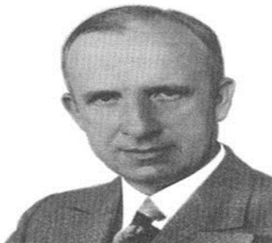
Abb. 19: Zweiter Institutsdirektor Otmar Freiherr v. Verschuer.