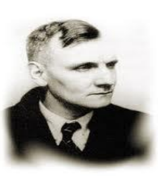
Imagen 16: Kurt Gerstein