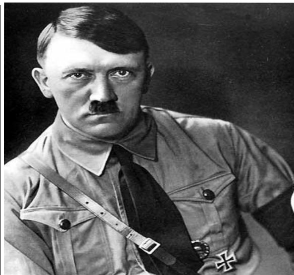
Imagen 2: Adolf Hitler