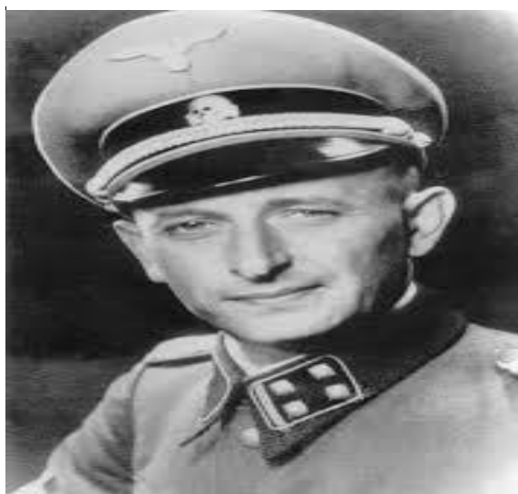
Imagen 14: Adolf Eichmann