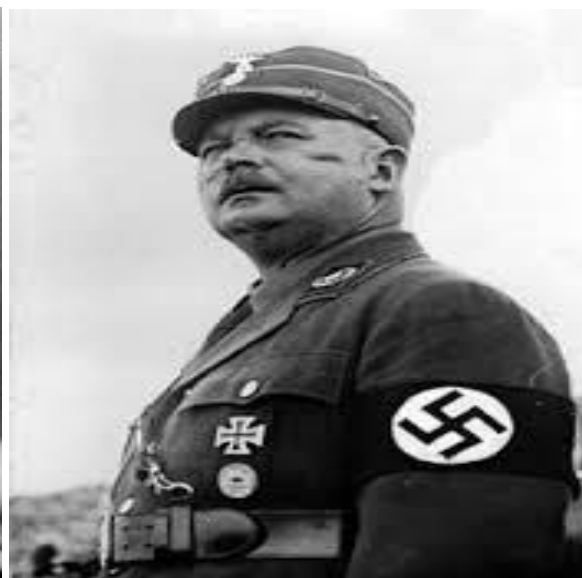
Imagen 4: Ernst Rohm