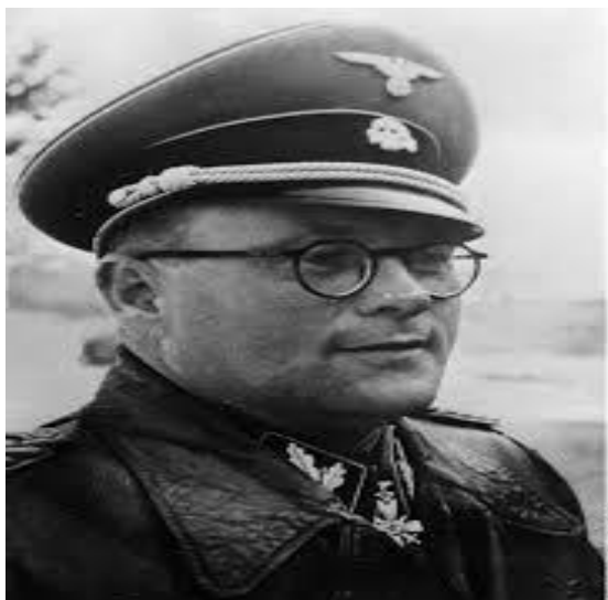
Imagen 21: Karl Clauberg