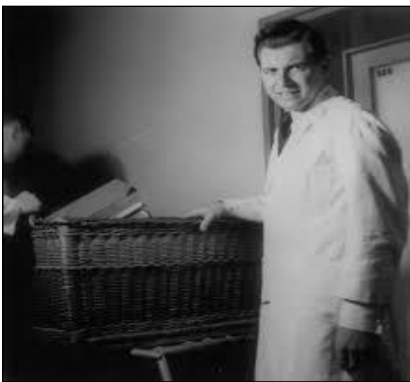
Imagen 1: Josef Mengele.