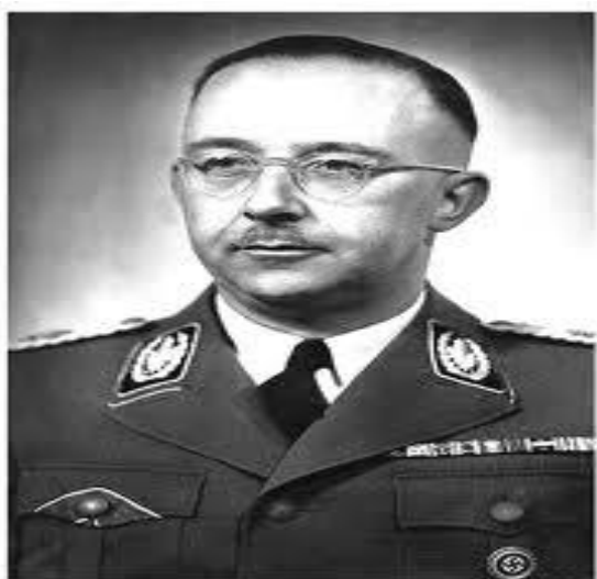
Imagen 7: Heinrich Himmler