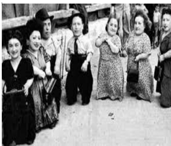
Imagen 20: familia de enanos Ovtiz