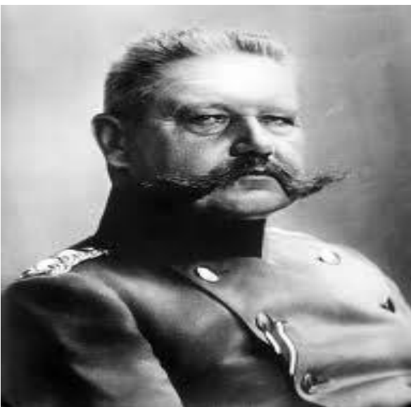
Imagen 3: Paul von Hindenburg