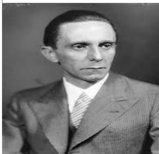
Imagen 8: Joseph Goebbels