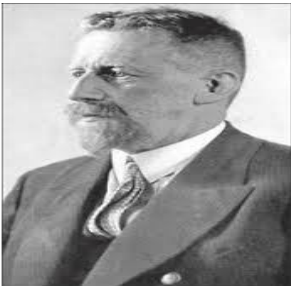
Imagen 5 Eugen Fischer