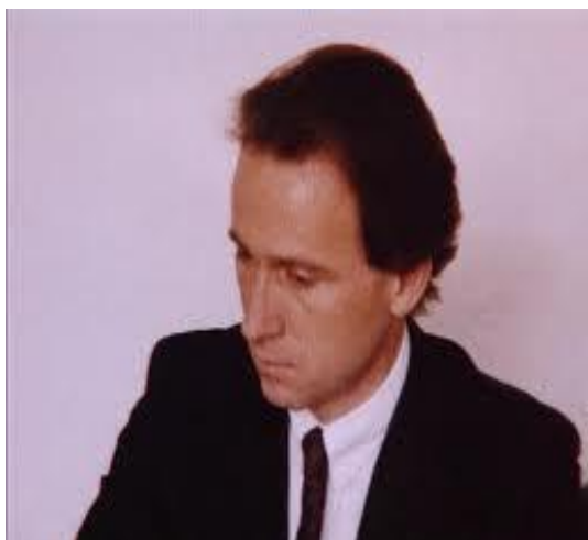
Imagen 19: Rolf Mengele