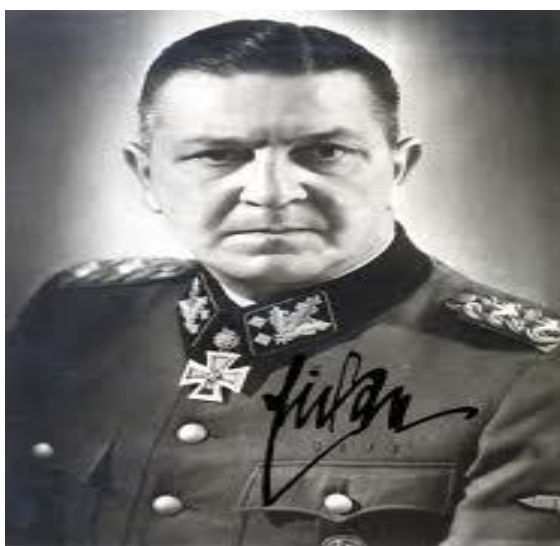
Imagen 11: Theodor Eicke