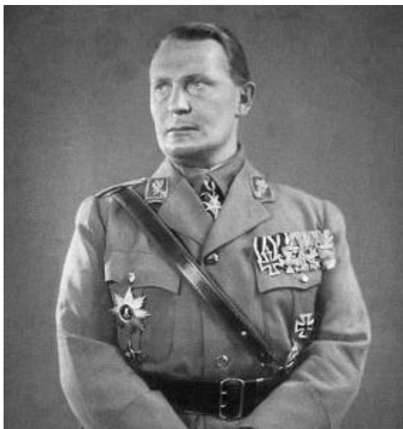
Imagen 9: Hermann Göring