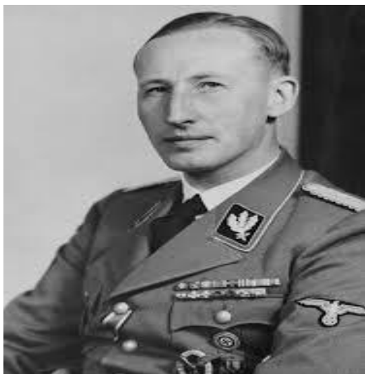
Imagen 13: Reinhard Heydrich