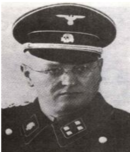
Imagen 15: Richard Glücks