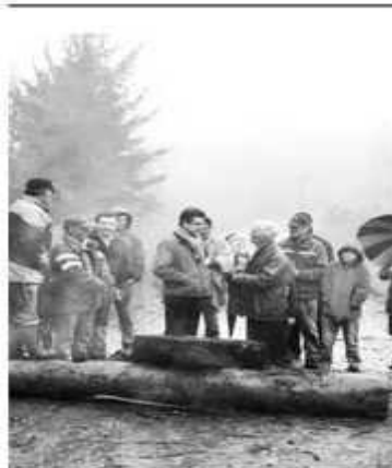
Los vecinos en el sector.

Pescadores artesanales realizan una violenta protesta en Coronel y cortan ruta hacia Lota y Arauco para pedir más cuotas de captura.