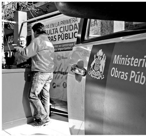
Pese a que la gente está votando, su elección de prioridades no servirá en forma práctica y sólo servirá de orientación.

Un ejemplo es el proyecto de embalse La Punilla o Lonquén salieron al final de lista de prioridades, lo que perfectamente puede ocurrir debido a que la consulta se hizo en Chillán y existen otros proyectos más masivos, como pavimentaciones y el hospital, en nada influiría sobre su construcción, por lo tanto la decisión de la gente de llevarlo a las postriberras del listado no ten-