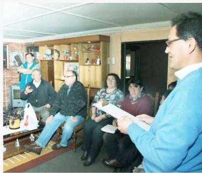
Tranquillos, los residentes de la población en la Costanera dijeron que esperarán conocer la propuesta del gobierno.