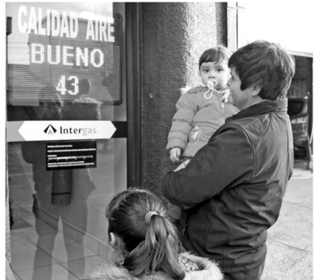
Sorprendidos se muestran los transeúntes al observar el semáforo cuyo índice ayer marcó 43 ug/m3, 7 puntos bajo la norma.

Según explica el empresario, la repercusión que han tenido estas acciones -que van de la mano con el apoyo de los diversos estamentos