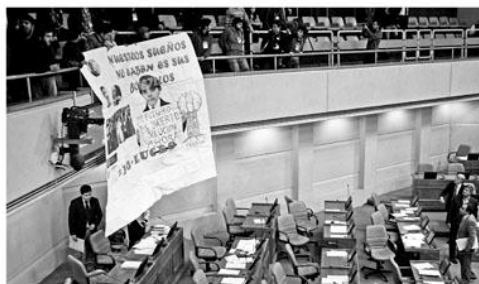
Estudiantes se manifestaron con lienzos durante la votación en la Cámara Baja.

dados de que el lucro -dijo que se perdió una batalla, pero no la guerra y anunció que van a seguir luchando para terminar el lucro en la educación superior.