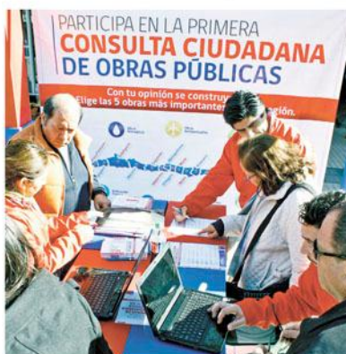
A través de este stand en el Paseo Arauco ayer se pudo votar.

El pasado martes, el ministro de Obras Públicas, Laurence Golborne,