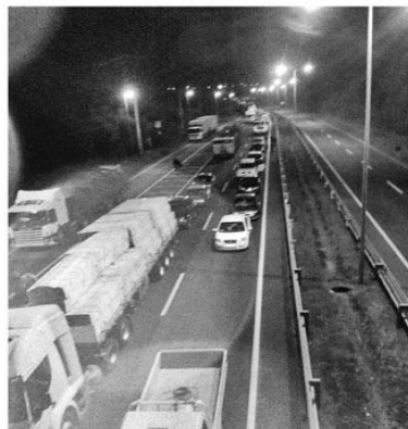
Alrededor de 4 horas estuvo detenido el tránsito.