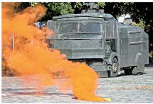
Sindicatos y trabajadores de la industria pesquera protestaron frente al Congreso.

El proyecto genera controversia y de inmediato pescadores artesana-