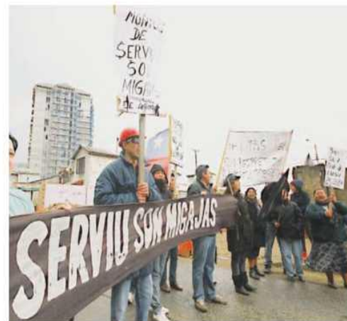
Vecinos están disconformes con los dineros entregados por el Serviu en razón de la expropiaciones en Tomé.