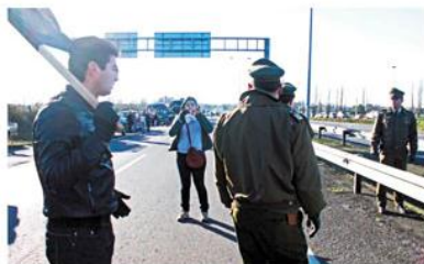
Es la tercera ocasión en que los pobladores se toman la carretera.

Una nueva toma a la Ruta 5 Sur protagonizaron anoche pobladores de Santa Clara, en rechazo al terreno para la construcción de la futura cárcel provincial.