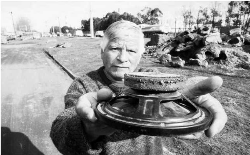
Los vecinos de la población Libertad en Talcahuano reclaman por contaminación. Incluso han salido con imanes para hacer pruebas acerca de los materiales particulados que hay en el sector.