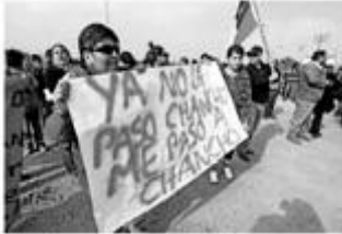
Manifestaciones en Freirina.

Tras la serie de protestas que se produjeron durante el fin de semana en la localidad de Freirina, Región de Atacama, por la persistencia de malos olores emanados desde la planta faenadora de cerdos de Agrosuper -que fue cerrada en mayo pasado- el ministro de Salud, Jaime Mañalich, aseguró que este problema "no se