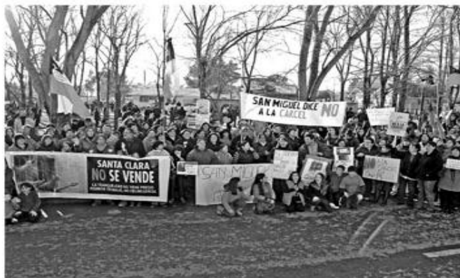
En la Plaza de Santa Clara se unieron vecinos y autoridades en torno al rechazo a la cárcel.

Al finalizar, las autoridades firmaron una carta en donde se comprometieron a seguir trabajando en torno al tema. (Corresponsal José Muñoz, Bulnes)