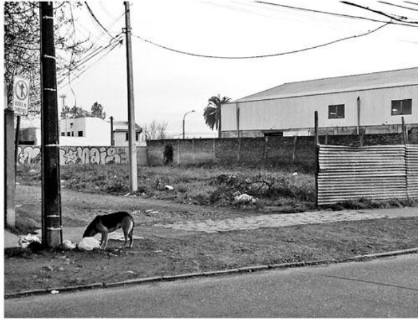
Terreno de los Pabellones es un punto de miedo para los vecinos del sector: hasta incendios se han provocado.