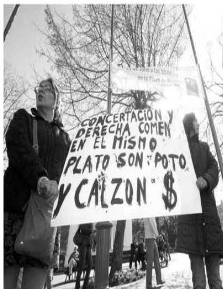
Con gritos y pancartas se manifestaron de forma pacífica en contra de los representantes de los partidos.