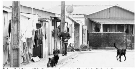
En Cerro Verde Bajo, son 113 familias las que serán expropiadas, 52 propietarias, 46 allegados, 2 en reservas municipales, 4 en áreas verdes, 8 sucesiones y en un caso se desconoce tenencia.

Respecto a la situación que viven los comerciantes del lugar, el alcalde dijo que es necesario analizar caso a caso, antes de tomar cualquier decisión.